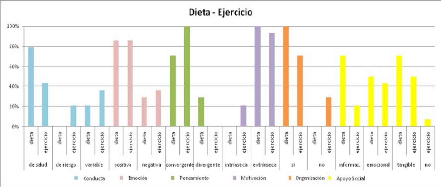
Gráfico 3: Comparativa entre los porcentajes correspondientes a las categorías y subcategorías comprendidas en los dominios temáticos DIETA Y EJERCICIO FÍSICO