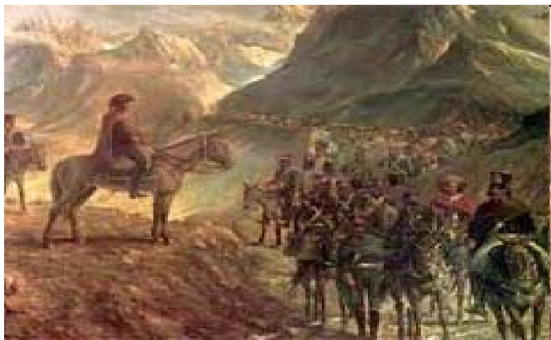
El General San Martín observando el avance de las columnas del Ejército.

El General José de San Martín, después de ser elegido Gobernador Intendente de Cuyo, dedicó sus esfuerzos a formar el Ejército Libertador, que recién a fines de 1816 estuvo en condiciones de emprender el cruce de Los Andes.