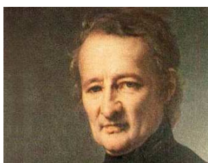
Juan María de la Mennais

La herencia recibida de sus Fundadores, autenticada por el reconocimiento pontificio en 1891, y guardada siempre con fidelidad, se transmite a los Hermanos de hoy. En un mundo de continuos cambios, quieren ponerse generosamente al servicio de los jóvenes.