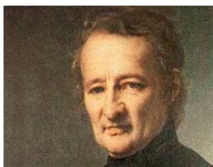
Juan María de la Mennais

La herencia recibida de sus Fundadores, autenticada por el reconocimiento pontificio en 1891, y guardada siempre con fidelidad, se transmite a los Hermanos de hoy. En un mundo de continuos cambios, quieren ponerse generosamente al servicio de los jóvenes.